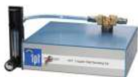
Подача рабочего газа для сварки медной проволокой