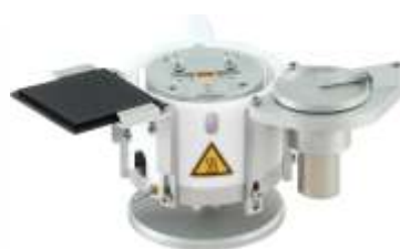
Нагревательные столики различной формы и размеров