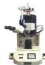
Тестер механических соединений PTR-1102 (Rhesca, Япония)