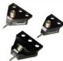
Зонды и карты пробников