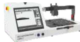
Система измерения угла смачивания поверхности