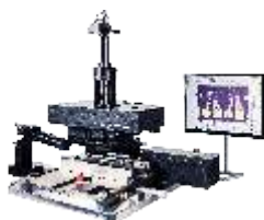
Установка монтажа кристаллов