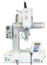
Паяльный робот Apollo Seiko