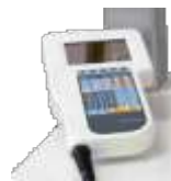
Пульт программирования робота