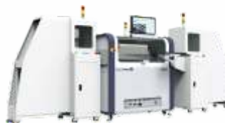
Установки конвейерного типа