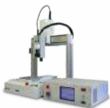
Настольные паяльные роботы