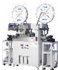
Автоматическая заготовка кабельных сборок